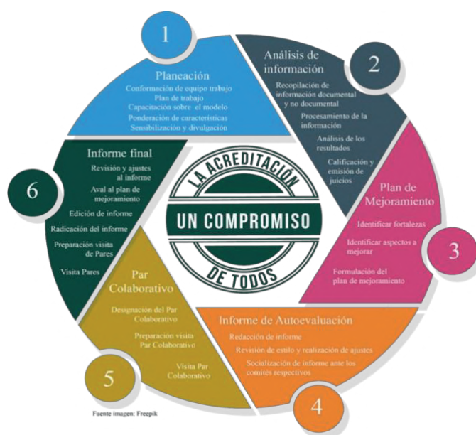
Gráfico 3. Ruta de la autoevaluación

Diseño del modelo de autoevaluación. El desarrollo del proceso de Autoevaluación de los programas Académicos en la Institución Universitaria de Envigado es una investigación evaluativa que surge de la necesidad de evaluar los programas académicos de la Institución, valorando el desarrollo de un conjunto de características que definen la calidad de un programa académico de Educación Superior. El estudio identifica y evalúa los discursos, los procesos, las actividades, las prácticas pedagógicas, así como las percepciones de los estudiantes, docentes, graduados, empleados y personal administrativo de acuerdo con indicadores cualitativos y cuantitativos de un programa académico.