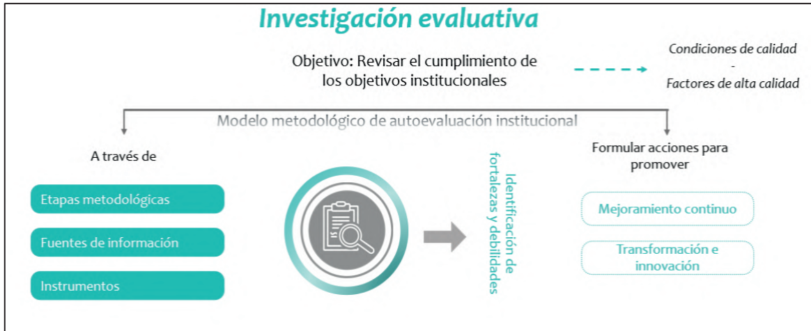
Gráfico 1. Concepto de autoevaluación de programas académicos

En este, se identifican y evalúan los discursos y las prácticas académicas, pedagógicas, investigativas, de extensión y administrativas, así como las percepciones de los estudiantes, docentes, egresados, empleadores, directivos y graduados enmarcadas en los diversos aspectos a evaluar de orden cualitativos y cuantitativos de un programa académico.