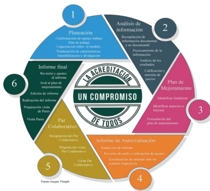
Gráfico 3. Ruta de la autoevaluación

Diseño del modelo de autoevaluación. El desarrollo del proceso de Autoevaluación de los programas Académicos en la Institución Universitaria de Envigado es una investigación evaluativa que surge de la necesidad de evaluar los programas académicos de la Institución, valorando el desarrollo de un conjunto de características que definen la calidad de un programa académico de Educación Superior. El estudio identifica y evalúa los discursos, los procesos, las actividades, las prácticas pedagógicas, así como las percepciones de los estudiantes, docentes, Graduados, empleados y personal administrativo de acuerdo con indicadores cualitativos y cuantitativos de un programa académico.